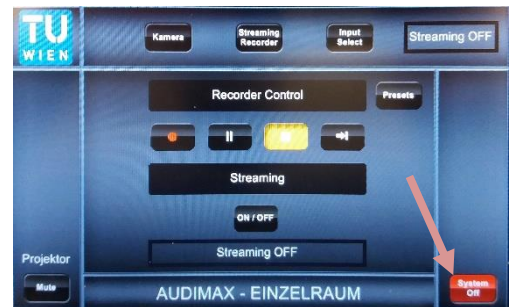
6. Nach der Veranstaltung System mit „System Off“ ausschalten