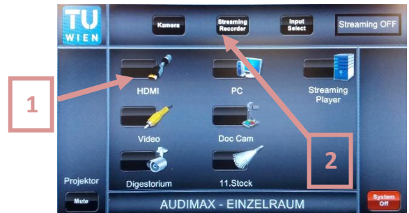
4. Gewünschte Quelle auswählen [1] und „Streaming Recorder“ drücken [2]