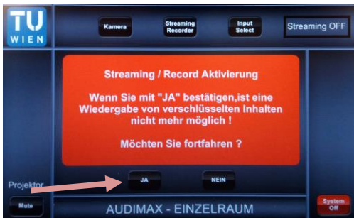
5. Abfrage mit „Ja“ bestätigen, dass beim Live Streaming sowie Aufnahme verschlüsselte Inhalte HDCP (z.B. urheberrechtliche geschützte Videos auf DVDs etc.) nicht wiedergegeben werden