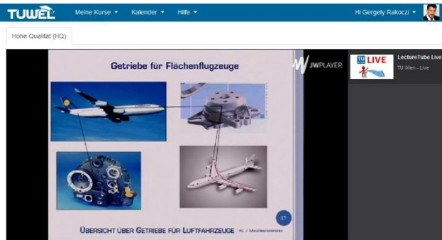
Übertragung der Präsentationsfolien