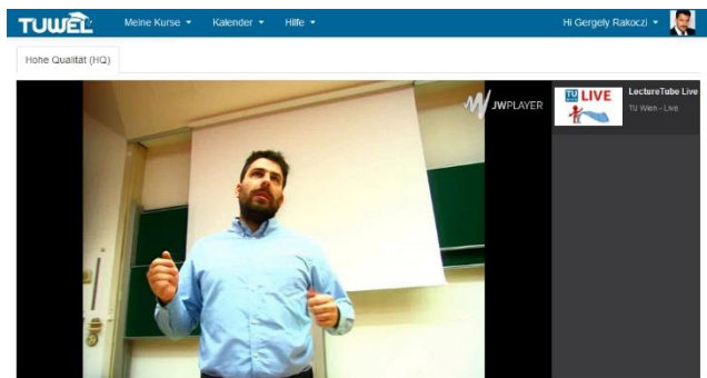
Übertragung der Vortragenden