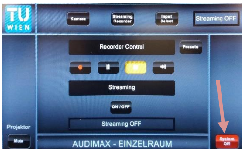
5. Nach der Veranstaltung System mit „System Off“ ausschalten