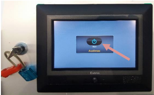
1. System mit Schlüssel aktivieren und „Start“ drücken