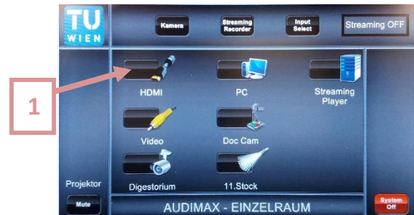
4. Gewünschte Quelle auswählen. Video und Ton werden in den Praktikumshörsaal übertragen. Starten Sie nun die Doppelraumnutzung auch für den Praktikumshörsaal gemäß der zweiten Anleitung.