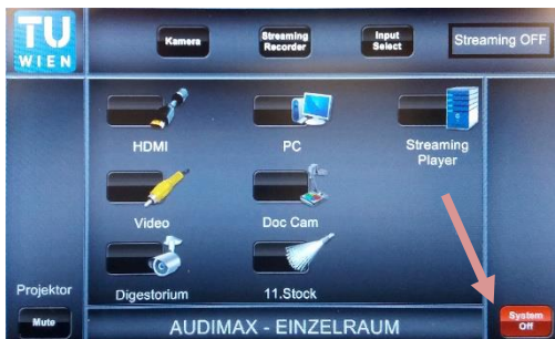
5. Nach der Veranstaltung System mit „System Off“ ausschalten