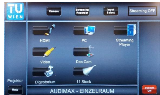
4. System ist zur Doppelraum-Nutzung bereit. Video und Ton werden vom Audimax übertragen.