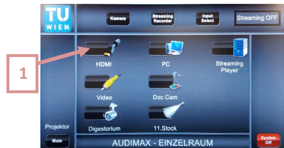
4. Gewünschte Quelle auswählen. Video und Ton werden in den Praktikumshörsaal übertragen. Starten Sie nun die Doppelraumnutzung auch für den Praktikumshörsaal gemäß der zweiten Anleitung.