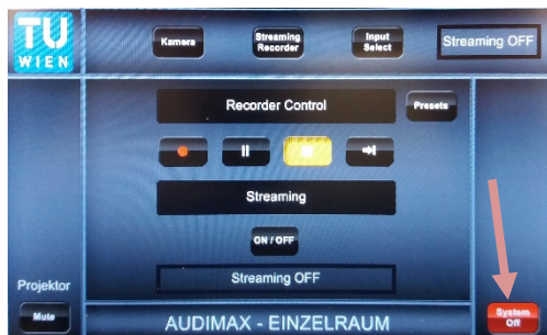
5. Nach der Veranstaltung System mit „System Off“ ausschalten