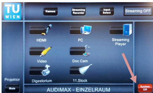
5. Nach der Veranstaltung System mit „System Off“ ausschalten