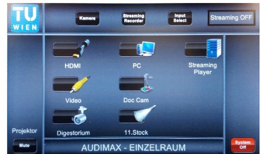
4. System ist zur Doppelraum-Nutzung bereit. Video und Ton werden vom Audimax übertragen.